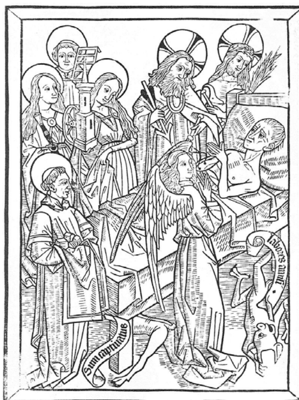
Abbildung 4: Triumph der Geduld (1740). Unbekannter Künstler. National Gallery of Art Washington, D.C.

So ging das hin und her; der Sterbende hatte noch die Anfechtungen der Demut durch den Hochmut sowie die Anfechtungen der Weltentsagung durch die Habgier zu durchleiden, bevor er sich „angesichts des Gekreuzigten“ (ebd., S. 2148) in sein Geschick fügte und seine Seele gerettet war (Abbildung 5). „Ein Mönch gibt dem Dahinscheidenden, während ihm die Augen brechen, noch die brennende Sterbekerze in die Hand. Ein Engel nimmt die Seele des Verstorbenen in Empfang. Die endgültig besiegten Teufel toben: Heu insanio. Furore consumor. Confusi sumus. Animam amisi-mus. Spes nobis nulla. Das macht mich wahnsinnig. Die Wut frisst mich auf. Wir sind