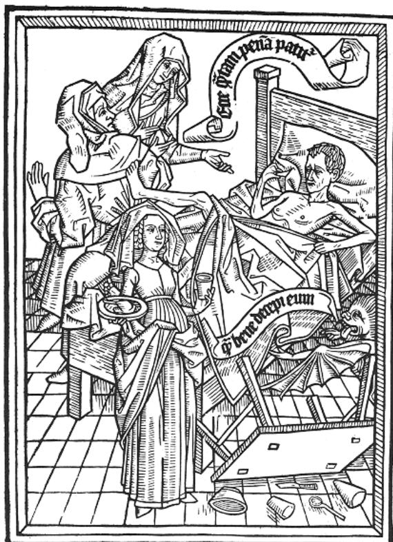
Abbildung 3: Versuchung zur Ungeduld (1740). Unbekannter Künstler.

2148). Auf dem Gegenbild (Abbildung 4) ist der Sterbende von Figuren umgeben, die durch ertragene Peinigungen zu Vorbildern wurden und ihre Folter- und Todesinstrumente in der Hand halten (ebd., S. 2148). So sieht man „Stephanus, der gesteinigt wurde, Katharina von Alexandrien mit Rad und Schwert, Laurentius mit dem Feuerrost und Barbara mit dem Turm. Ganz aussen steht Christus mit (...) Dornenkrone, Geißel und Rutenbündel“ (ebd., S. 2148). Und wieder sind die Teufel die besiegten und klagenden, „dass ihre Mühen umsonst waren“ (ebd., S. 2148).